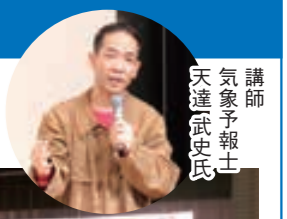
講師 気象予報士 天達武史氏

12月14日(土)、中央市民会館で越谷市コミュニティ推進協議会主催のまちづくり講演会が行われました。講師は気象予報士 天達武史氏、テーマは「天気の人から見た 異常気象と気象災害への備え」でした。低地越谷における災害の推移や近年の台風の発生状況、気象変化で熱中症が増えている等の説明がありました。また、気象情報に注意して早目の防災対策、避難行動がとて重要になります。災害時には、薬など人から借りることができないものを身近に携帯することが大切です、とのこと。 この講演会ではクイズ形式での学びもあり、それを活かして今後の災害時に備えたいものです。