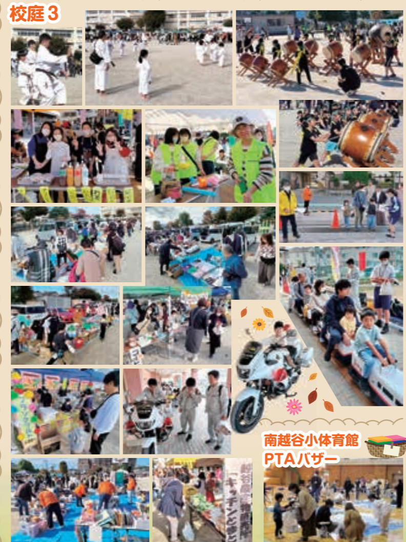
南越谷小体育館 PTAバザー