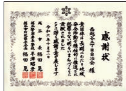
地域安全活動功労団体 南越谷三丁目自治会

10月11日(金)、第30回越谷市地域安全推進大会・越谷市暴力排除推進大会が越谷市中央市民会館にて開催されました。地域安全活動功労団体及び功労者5名に感謝状と記念品が授与されました。南越谷地区の受賞者は以下のとおりです。