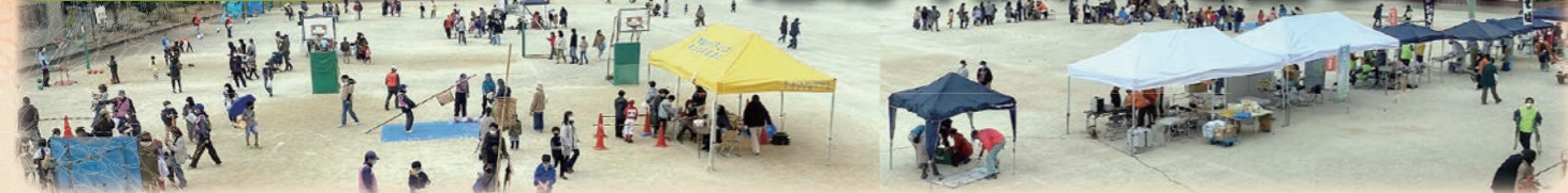
南越谷小校庭・地区センター