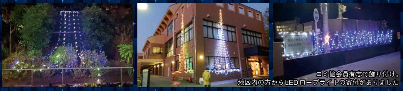
コミ協会員有志で飾り付け。地区内の方からLEDロープライトの寄付がありました