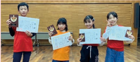
2月4日、高学年4名が市の大会に出場

12月17日(土)、地区センター多目的ホールで高学年23名、低学年15名で地区大会が開催されました。コロナ禍の中、県・市に準じて個人戦のみとなりました。「まがたまは〜かことみらいのくびかざり〜」とさわやかな声でジュニアリーダーが読み始め、始まりました。結果は左記の通りです。