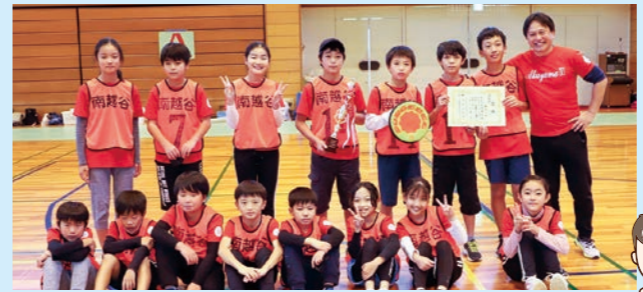
【優勝】川柳 【準優勝】南越谷A 【3位】桜井・増林

12月10日(土)、越谷市総合体育館にて、第9回越谷市ドッチビー大会が8地区10チームの参加で開催されました。この大会は近年、年齢の違う子どもたちと遊ぶ機会が減少している中、ドッチビーを通して体力向上を促し、礼儀やチームワークの大切さや集団活動の充実を図ることを目的としています。南越谷Aは準優勝でした。おめでとうございます。