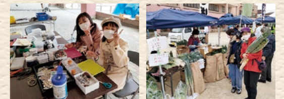
風車の会 イヤリング作り