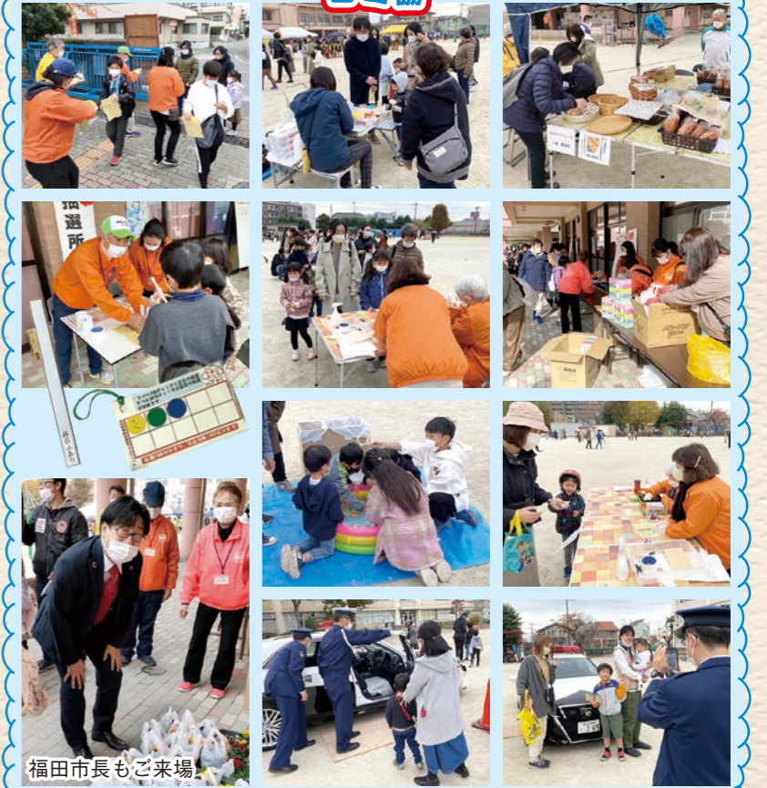
福田市長もご来場