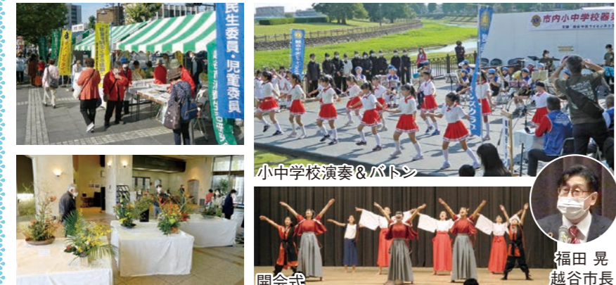
小中学校演奏&パトシ

10月23日(日)、本年度は2エリア①市役所・中央市民会館周辺エリア、②大相模調節池(レイクタウン)周辺エリアの特徴を生かした開会式典をはじめ、スポーツ、文化(演奏・踊り・作品展示)、遊具、キッチンカー、体験、展示・PR、表彰等が繰り広げられました。