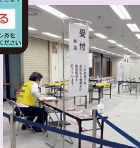
サンシティの接種会場

5月17日から75歳以上のコロナワクチン接種が始まりました。「予約が取れなかったのでも予約ができるよう、ワンタッチ画面を作成し配信しました。分らない点があれば、地区センター窓口で相談に応じます。 南越谷地区LINEでは、高齢者やスマホの操作が苦手な方も予約ができるよう、ワンタッチ画面を作成し配信しました。