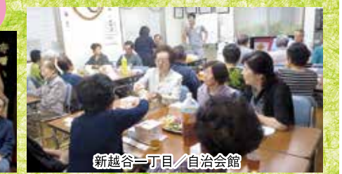
新越谷一丁目/自治会館