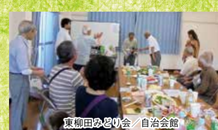
東柳田みどり会/自治会館