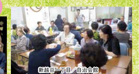
新越谷一丁目/自治会館