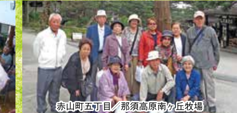
赤山町五丁目/那須高原南ヶ丘牧場