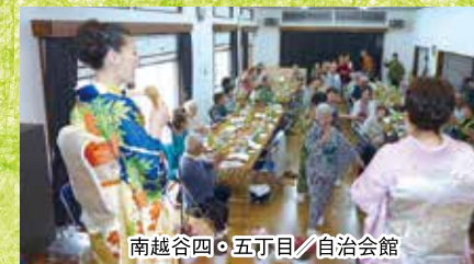
南越谷四・五丁目/自治会館