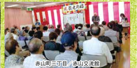
赤山町三丁目/赤山交流館