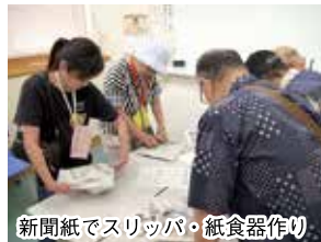
新聞紙でスリッパ・紙食器作り