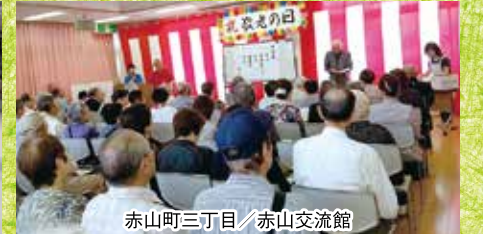
赤山町三丁目/赤山交流館