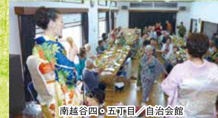
南越谷四・五丁目/自治会館