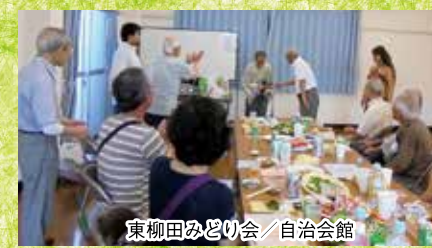
東柳田みどり会/自治会館