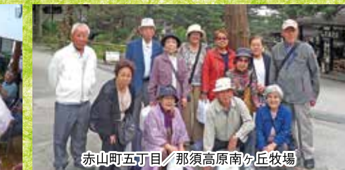
赤山町五丁目/那須高原南ヶ丘牧場