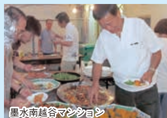
墨水南越谷マシソン