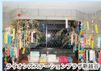
ライオンズステーションプラザ新越谷