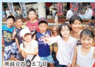
南越谷四・五丁目