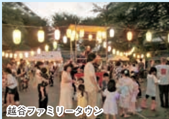
越谷ファミリータウン