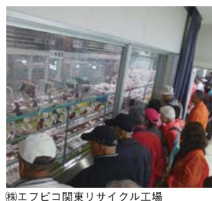
(株)エフピコ関東リサイクル工場

次にヤクルト本社茨城工場へ向かいました。ここでは原料液とビフィズス菌飲料B.F.1を生産していました。原液製造から容器製造・出荷までのラインを見学。食品を扱う各ラインと作業員の衛生管理には、ただただ感心しました。