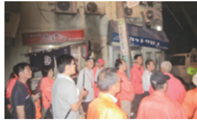
クイズを解きながらの脱出体験ツアー

災害が発生し停電時の避難がいかに恐怖感を与えるか、そして冷静に状況判断、情報確認が必要か体験できました。ツアー