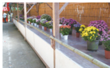
笠間稲荷神社の菊まつり

花いっぱい運動 環境・衛生部会 日時/12月1日(土) 午前9時~ (雨天時12月8日(土)) 集合場所:地区センター前 対象/小学生以上 内容/地域環境向上活動の一環として、鳩ヶ谷別府線沿いの花壇において清掃及び花壇の花植えを行います。