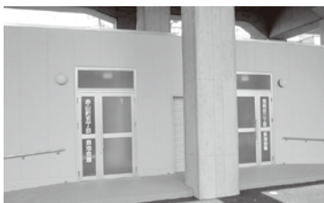
正面より向かって 右側：南越谷二丁目自治会館 左側：赤山町五丁目自治会館

両自治会館はそれぞれ会館ができたので、自治会の会合、老人会、婦人会、子ども会などのふれあいの場として活用されることでしょう。 S・S