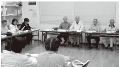
赤山町五丁目自治会館風景