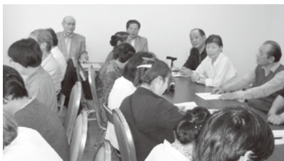
南越谷二丁目自治会館風景