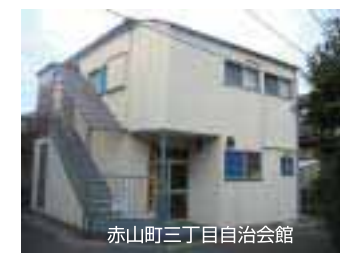
赤山町三丁目自治会館