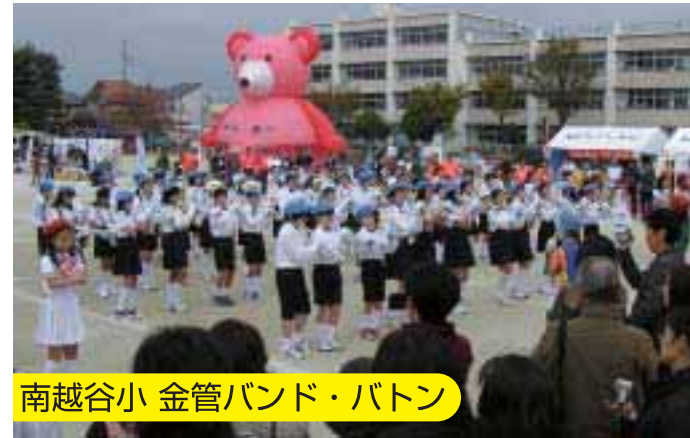
南越谷小 金管バンド・パトロン

2日間で307名の方にご協力頂き、回収量は28,200個でした。H20.11.17現在、累計533,280個。ポリオワクチン666,6人分となりました。これからも宜しくお願いします。