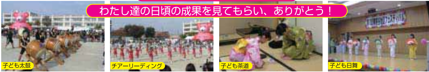
子ども太鼓 チアリーダー チェアリーダー チェアリーダー 子ども茶道 子ども日舞

晴天の校庭で日頃練習の成果を披露、会場の雰囲気華やかなり、家族の声援とカメラマンで満杯。