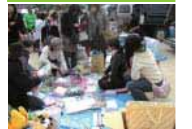
何か掘り出し物がないかな? 目利きと買い物上手で交渉成立。