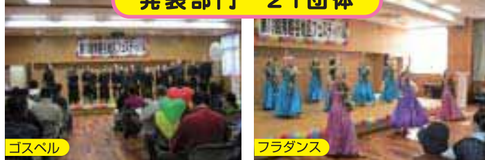
各ステージでは練習の成果を十分に発揮していました。