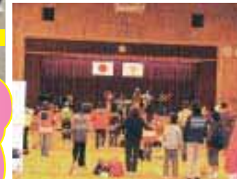
ギターのハードなリズムと踊る太鼓が響き渡り、エイサー・エイサーと踊りまくる。