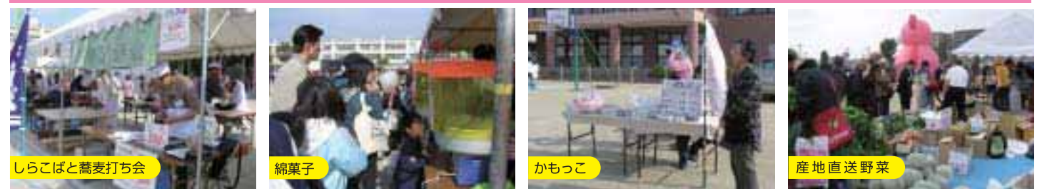
しらこぼと蕎麦打ち会