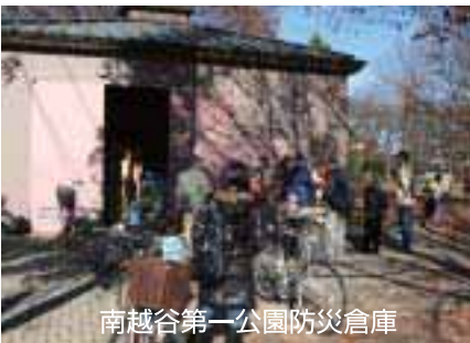
南越谷第一公園防災倉庫

このウォークラリーは、早く目的地に到着するのではなく、定められた道順で地図を確認しながら、災害に備えて備蓄されている食料品・防災機材等の見