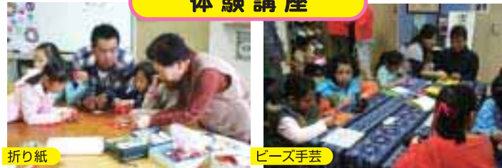
作り方を教えてもらい、出来上がった作品に大満足!