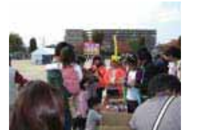
お兄ちゃんに子ども達がバルーン作りの手ほどきを受け、バルーンをもらって大喜び!