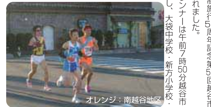
オレンジ：南越谷地区

12月7日(日)市制施行50周年記念第53回越谷市内駅伝競走大会が行われました。厳しい寒さの中、ランナーは午前7時50分越谷市役所を一齐にスタートし、大袋中学校・新方小学校・増林小学校等を中継。ゴールの中央市民会館前までの6区間23.2kmを疾走し、1本のたすきをつなぎました。合計75チームが参加。南越谷地区は2つの区間賞を取るなどの大健闘もあり、堂々の準優勝を飾りました。 T・N