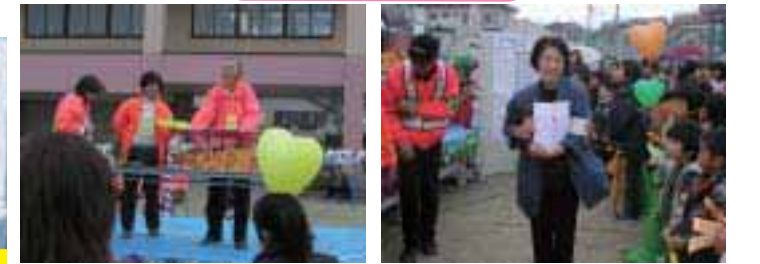
透明の抽選箱をかきまぜて、取り出したその手に一喜一憂。見事当たった方は、感謝感激!