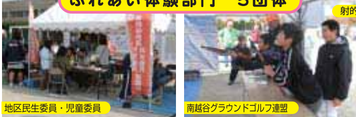
地区民生委員・児童委員 アンケートとお茶や健康相談などのサービスでPR活動。 スマートボール・射的・グラウンドゴルフは、子ども達に大好評。