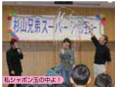
私シャボン玉の中よ!