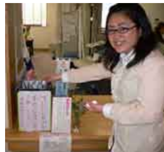
地区センター窓口収集箱設置